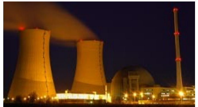
Industria nucleare Ispezione visiva remota nell'industria nucleare