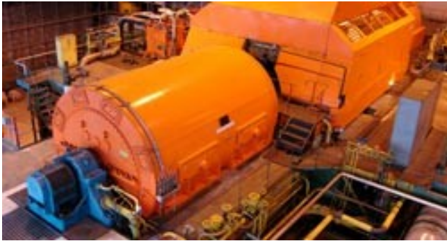
Turbine e generatori Ispezione visiva remota di turbine e generatori