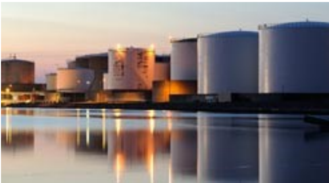
Serbatoi e cisterne Ispezione visiva remota di serbatoi e cisterne