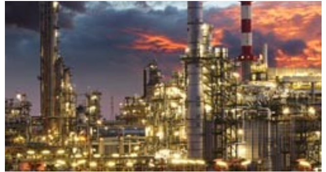
Raffineria Ispezione visiva remota in raffinerie