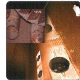
Boiler + burner detail (zoom 18x)