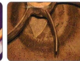
Pitting in reactor

FIBEROPTIC Fiber Optic Italia Srl – Via Sporting Mirasole, 23/15 – I 20090 OPERA (MI) – tel: +39 02 53031237 – Fax: +39 02 53030301