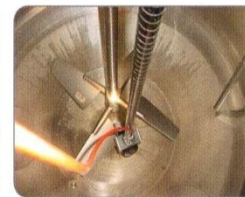
SNK reactor inspection