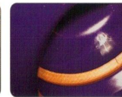
Defective seal in glass lined tank